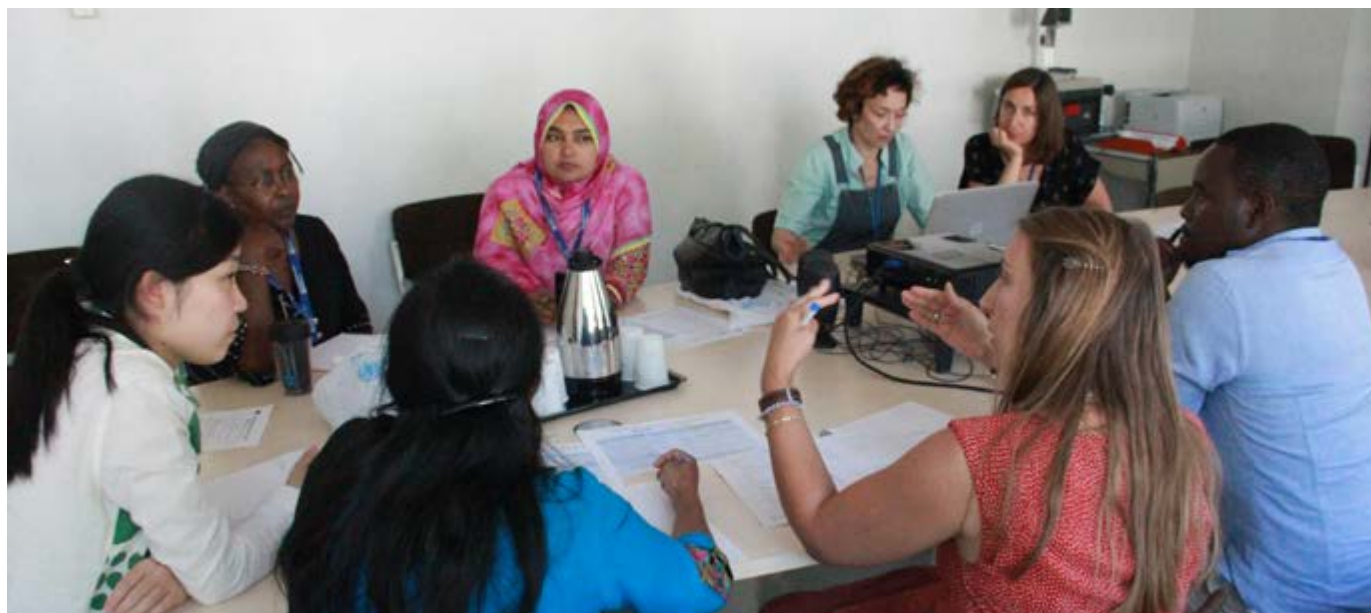
Figure 2. Université d'été du CIRC 2017, module : Mise en œuvre de la prévention et de la détection précoce du cancer.

Organisée conjointement avec la conférence scientifique du 7 au 10 juin 2016, à Lyon, lors des célébrations du 50 ème anniversaire de la création du Centre, l'initiative « 50 pour 50 » du CIRC est un programme de bourses qui a réuni 50 futures têtes de file de la recherche sur le cancer, originaires des PRFI, une pour chaque année d'existence du CIRC. Les candidats sélectionnés étaient originaires de 36 pays. Le programme d'une semaine incluait la participation aux 3 journées de conférence scientifique, un atelier de travail pré-conférence sur 2 jours, ainsi qu'une série d'activités de réseautage pour favoriser les collaborations. L'installation d'un espace en ligne dédié au travail préparatoire leur donnait accès à tout un ensemble de ressources et d'activités de mise en réseau. La plupart des participants ont jugé l'initiative très positive, soulignant la qualité des interactions et la possibilité qui leur était donnée de s'informer sur un grand nombre de sujets de recherche et de rencontrer les experts mondiaux dans ces domaines.