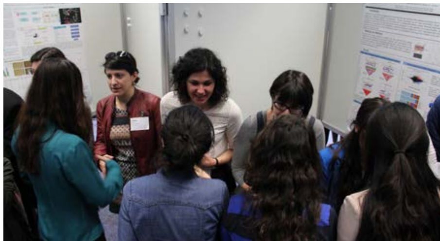
Figure 1. Journée Sciences et Carrière 2016 organisée par l'ECSA.

Annulée en 2016, pour cause de restrictions budgétaires, l'Université d'été du CIRC en épidémiologie du cancer a repris en 2017. Les cours visant à améliorer les compétences pratiques et méthodologiques des professionnels de santé et des chercheurs en cancérologie se sont déroulés à Lyon, de juin à juillet 2017. Un nouveau module d'une semaine consacré à la mise en œuvre de la prévention et de la détection précoce du cancer (Figure 2) s'est déroulé parallèlement au module traitant des Méthodes d'estimation de la survie pour les registres du cancer, suivi du module d'introduction à l'épidémiologie du