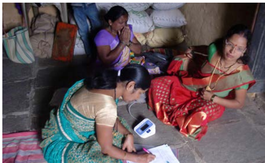
Figure 6. Mobilisation en faveur du dépistage du cancer dans une zone rurale, en Inde.

et coll., 2017 ; Sangrajrang et coll., 2017). L'étude thaïlandaise a également montré l'efficacité élevée de la cytologie en milieu liquide pour trier les femmes VPH-positives (Sangrajrang et coll., 2017). Par ailleurs, le Groupe SCR a