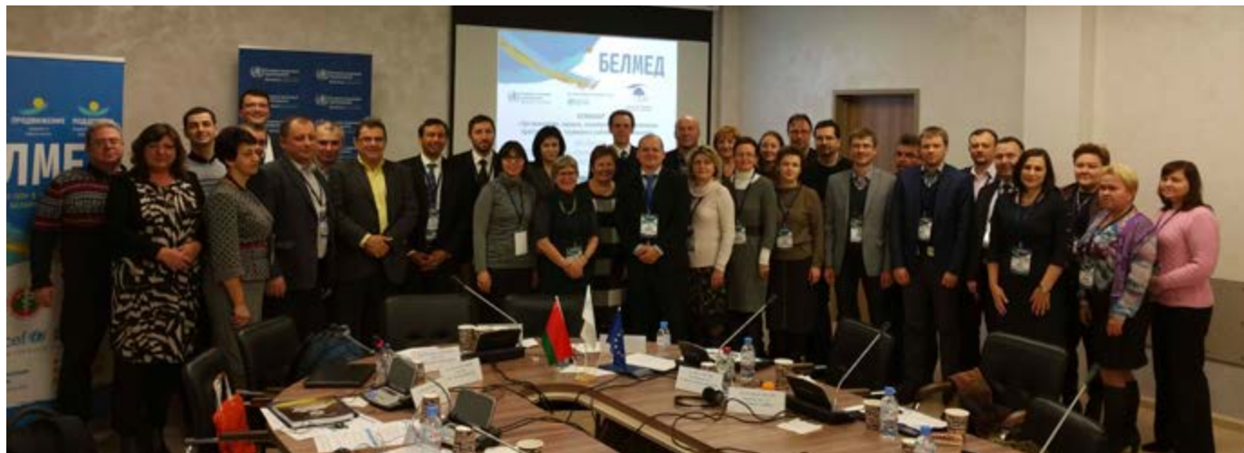
Figure 4. Cours de formation à l'épidémiologie et au dépistage du cancer du sein en Biélorussie, décembre 2016.

vaccinale. A cette fin, en collaboration avec des chercheurs universitaires français, le Groupe PRI a développé et piloté une campagne d'information sur la prévention des infections à VPH, basée sur les théories de changement de comportement, et dont l'efficacité sera testée au cours d'un essai clinique aléatoire, conduit à Lyon.