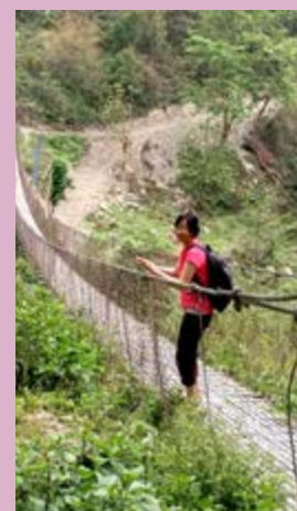
Infirmière bhoutanaise en route vers un dispensaire rural pour procéder au dépistage du cancer du col utérin.

Enfin, le Groupe ICE a contribué à la création de bases de données informatisées et de biobanques d'échantillons d'urine, de cellules cervicales et de biopsies. Il a aussi facilité les échanges entre experts locaux et internationaux au CIRC et lors de réunions scientifiques internationales. Le personnel du CIRC supervise également quelques étudiants en master et en doctorat, originaires du Bhoutan et du Rwanda, et nombre d'étudiants de ces pays ont pu faire un bref séjour au CIRC ou assister à son Université d'été.