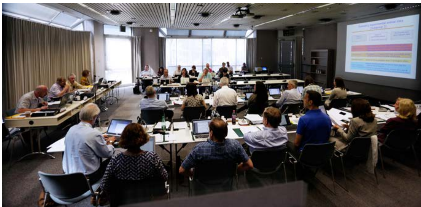
Figure 1. Groupe de travail des Monographies du CIRC .

Le Groupe IMO et son prédécesseur, la Section des Monographies du CIRC, ont organisé six Groupes de travail au cours de la période biennale 2016–2017 (Figure 1). Ces évaluations ont concerné 10 agents classés hautement prioritaires et 8 autres jugés moyennement prioritaires ou moyennement à hautement prioritaires par un Comité consultatif qui s'était réuni en 2014. Les six réunions ont eu lieu comme suit :